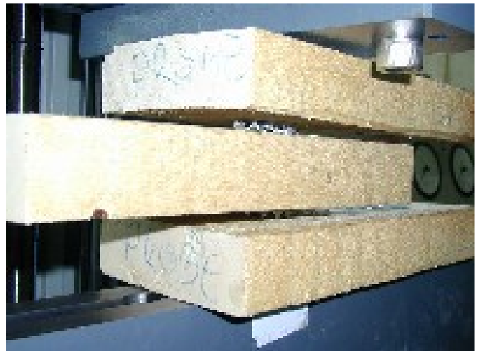
Herstellen der Versuchskörper