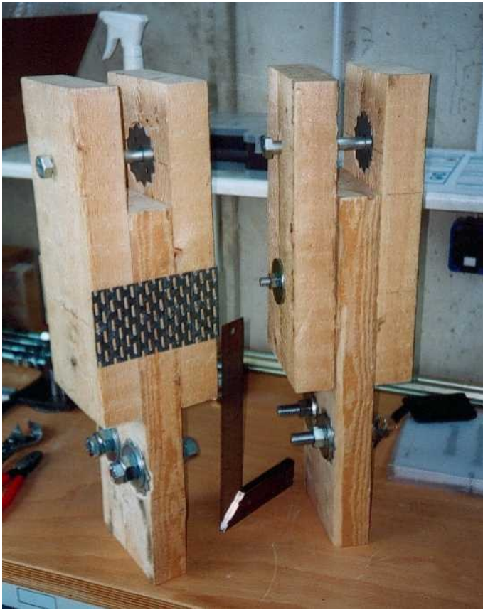
Versuchskörper Nagelplatte links und Einpressdübel rechts